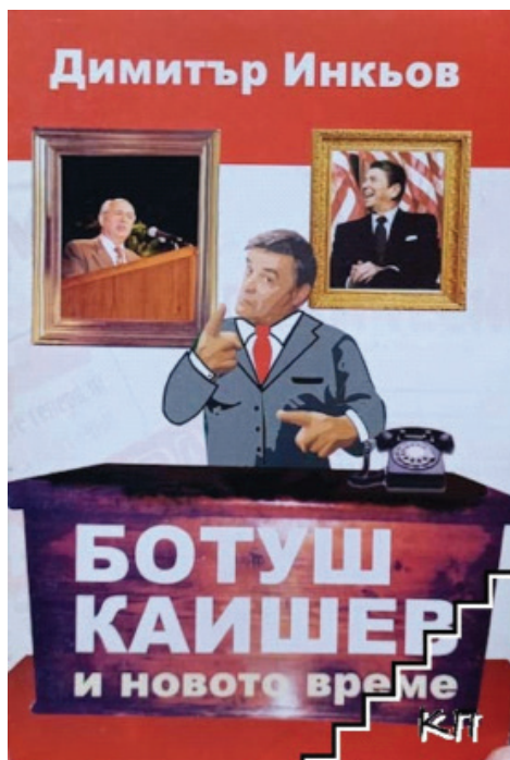
Buchcover von Botusch Kaishev und die Neue Zeit, 2004.